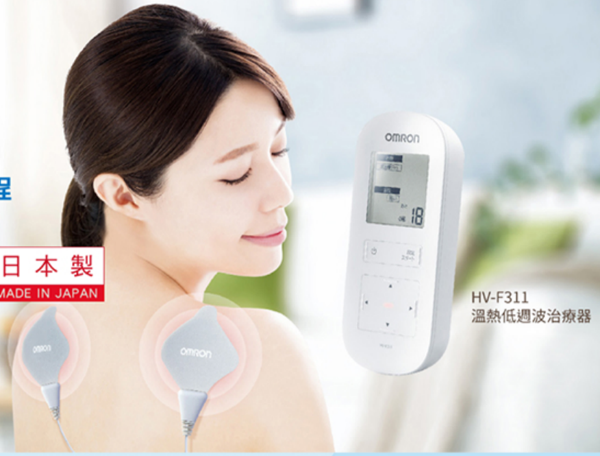
HV-F311 溫熱低週波治療器